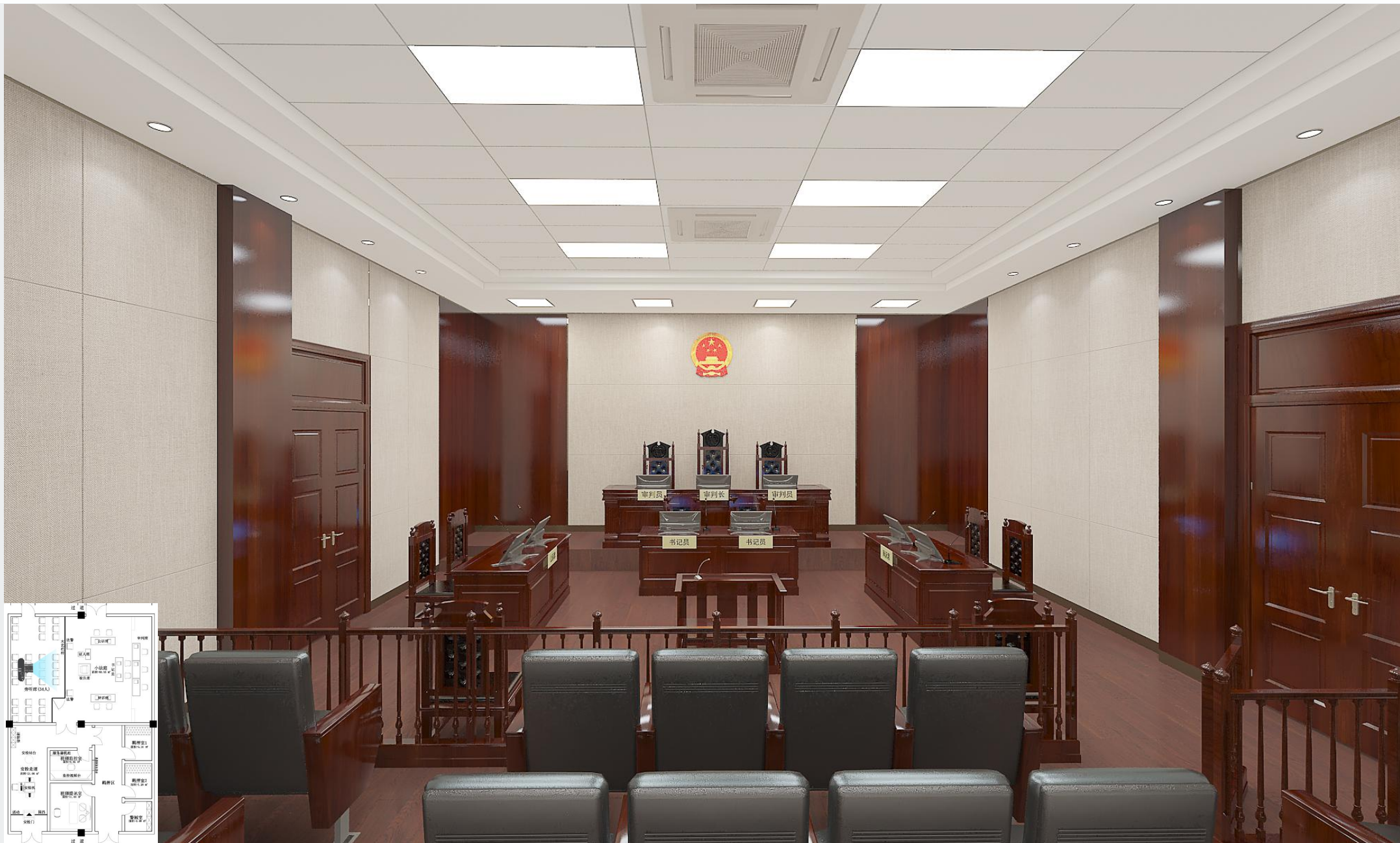
小法庭教室效果图