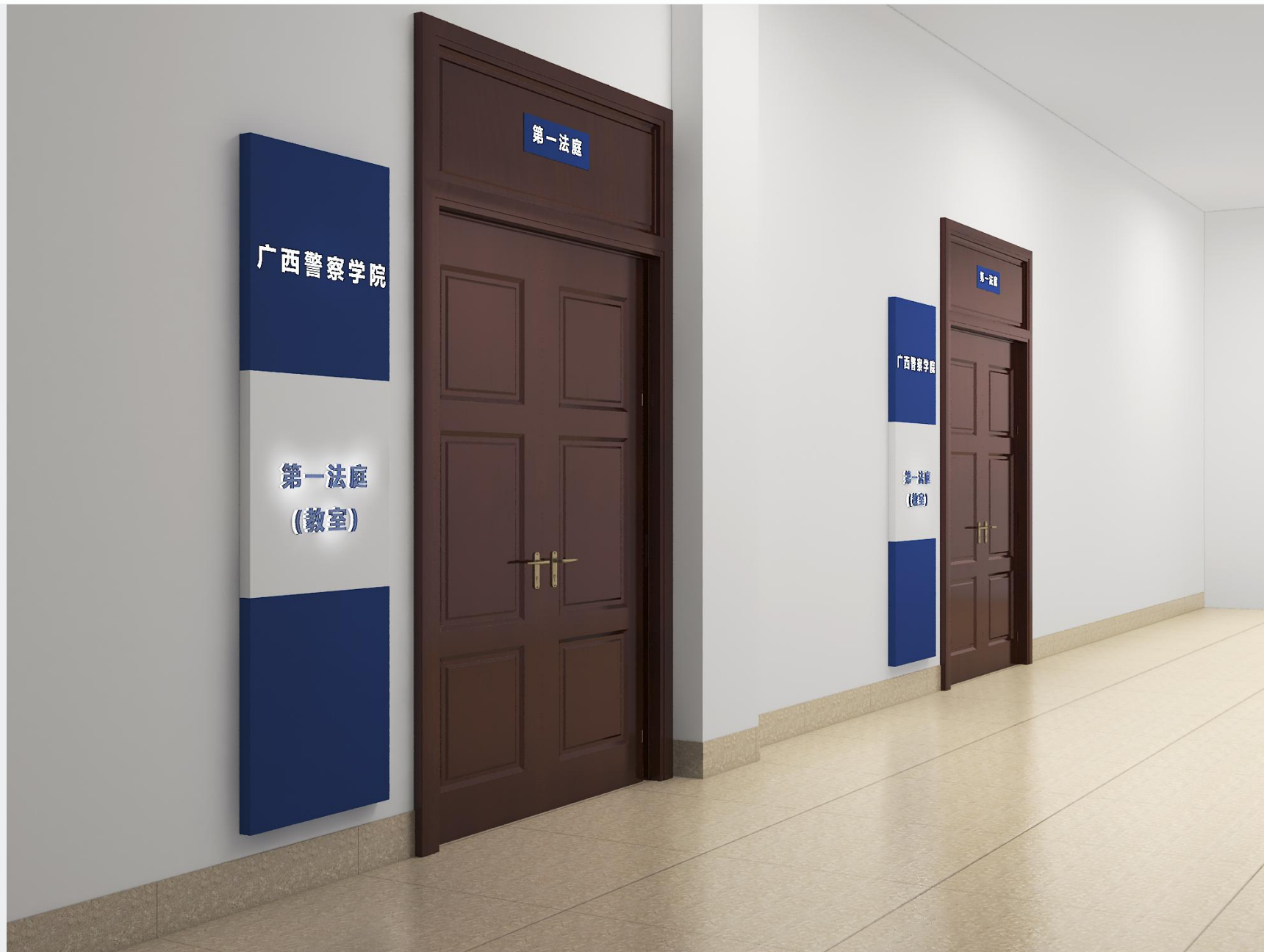
过道展示牌效果图